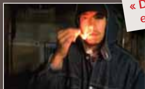
« Deux humains » et leurs invités