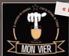
« Mon vier »