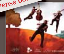
« Pense bête »